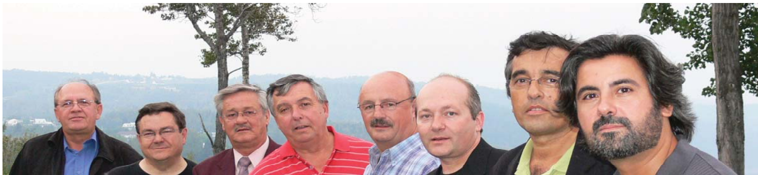
La coalition menée par le CNC visant l'adoption du projet de loi C-269 était en conseil au Domaine Forget dans la région de Charlevoix les 7 et 8 septembre 2007.

Nous sommes fiers et heureux d'être de nouveau réunis !