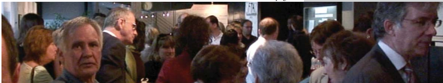
Photo prise lors d'une activité de financement pour le Conseil National des Chômeurs et Chômeuses, un vin et fromage organisé à la Cinémathèque Québécoise le 12 mai 2009. Durant ce 5 à 8, le CNC a présenté le documentaire, À FORCE DE CONVICTION. voir p.4

À cette occasion, nous comptons réunir toutes les personnes et organisations représentatives et impliquées, d'une façon ou d'une autre, dans le « dossier chômage ». L'amélioration du régime d'assurance-emploi est plus que jamais une priorité pour le bien de l'ensemble des travailleurs, pour les collectivités et pour la société en général, il est donc opportun de profiter du contexte actuel pour démontrer l'importance de la cause. Soyez des nôtres et faites partie de la solution.